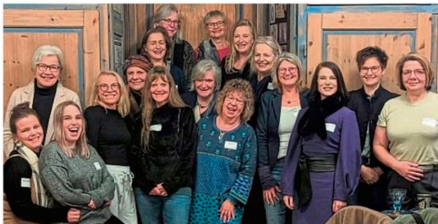
Netzwerktreffen: Bei der ersten Zusammenkunft in diesem Jahr hatten die Teilnehmerinnen viel Spaß.