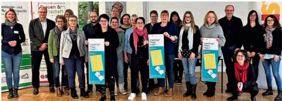
Sie wollen betriebliche Pflegelotsen werden: Der neue Weiterbildungskurs startete jetzt. Im Bild die Teilnehmer, Initiatoren und Projektbetreuer.